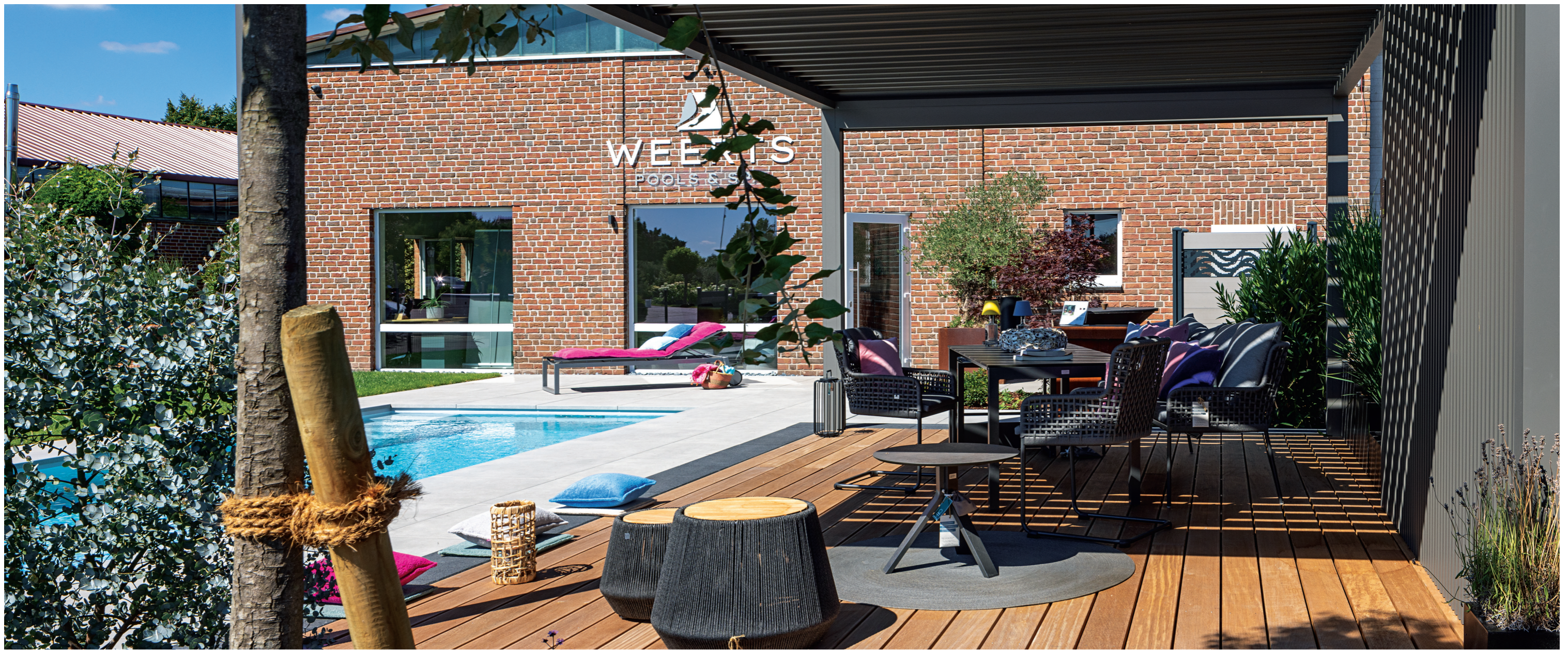
Der „High Quality Pool“ von VPS steht im Schaugarten des Schwimmbadbauers Florian Weerts in Meerbusch. Dazu gehören auch Whirlpools der Marke „Strato“, eine Outdoorküche und ein Terrassendach von Renson.